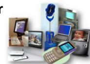
Fasta visningsmiljöer - med välfärdsteknologi