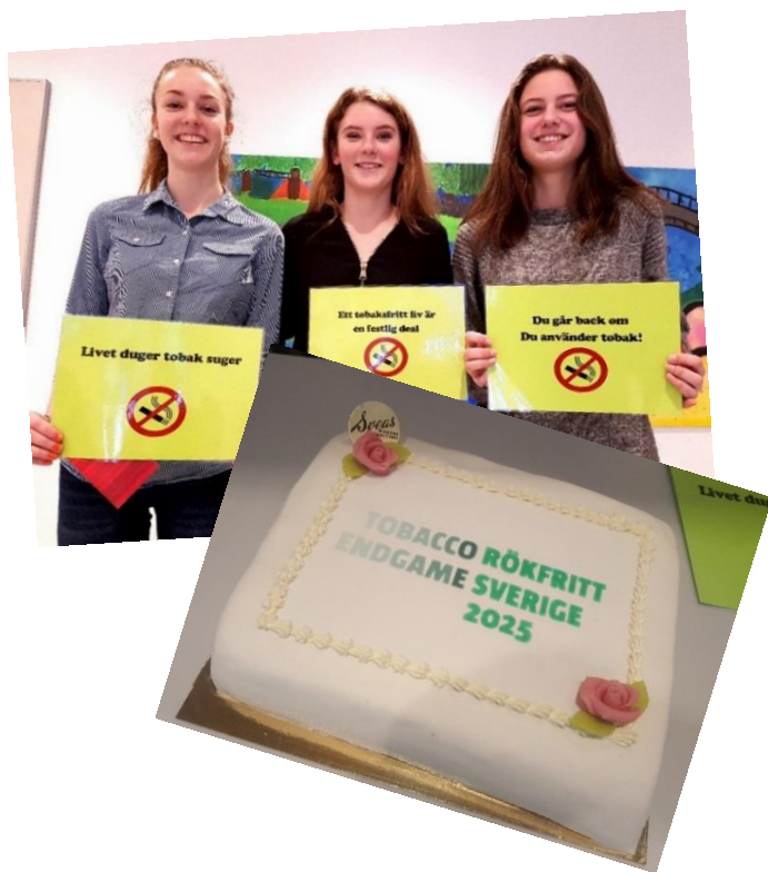
Elever i åk 7 som aldrig har druckit alkohol

Under Tobaksfria veckan v.47 i höstas fick ungdomar på fritidsgårdar i Sydnärke vara med i en tävling som innebar att komma på egna slogans för just Tobaksfria veckan. Detta var ett initiativ av samverkansgruppen SAMSYD som sedan utsåg tre vinnande bidrag. Ungdomarna bakom bidragen vann biobiljetter som delades ut på fritidsgården Hörnan i Askersund då det också bjöds på tårta. De vinnande bidragen kommer att tryckas upp på planscher som ska sättas upp inför Tobaksfria dagen den 31/5.