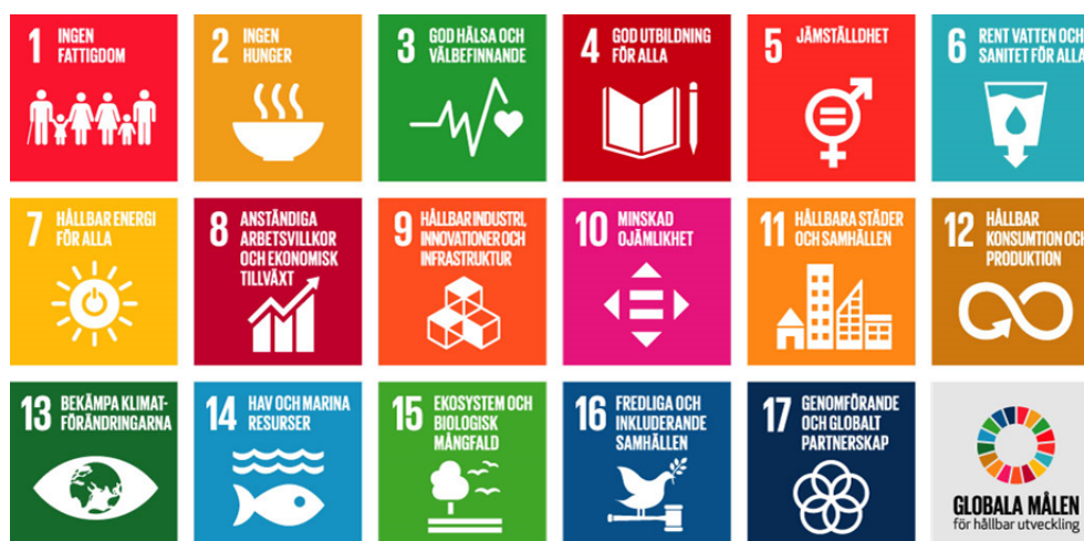
Figur 1. De globala målen för hållbar utveckling

Agenda 2030 och de globala målen antogs av världens stats- och regeringschefer vid FN:s toppmöte i New York, den 25 september 2015. Agendan består av 17 mål och 169 delmål för hållbar utveckling. Målet är att till år 2030 genomföra en samhällsförändring som leder till en ekonomiskt, socialt och miljömässigt hållbar utveckling som skyddar vår planet, utrotar fattigdom och genererar en god välfärd för alla människor. Globala målen är integrerade och odelbara och balanserar de tre dimensionerna: den ekonomiska, den sociala och den miljömässiga. De tre dimensionerna måste samverka och förhålla sig till varandra för att kunna bidra till en hållbar utveckling. Världens regeringar är ansvariga, men de globala målen berör oss alla och kommunen är en viktig aktör för att nå målen.